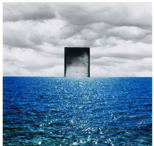
Stèle(s) - Étude / Paysages, Exquis, 2020, Nasri Sayegh © Nasri Sayegh

Co-commissaires : Laure d'Hauteville, Clémence Cottard Hachem